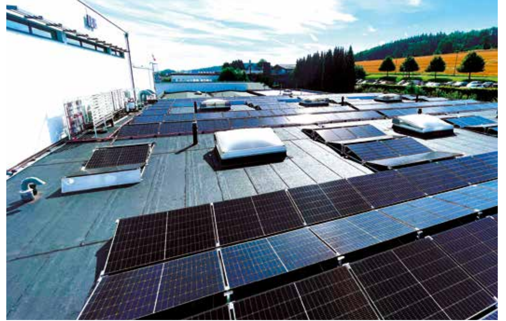
PV-Anlage am Hauptsitz in Neuenrade: Diese Investition unterstreicht unser Engagement für eine nachhaltige und umweltfreundliche Produktion. PV system at the headquarters in Neuenrade: investment emphasises our commitment to sustainable and environmentally friendly production.

By commissioning a high-performance photovoltaic system at our headquarters in Neuenrade, we are actively investing in environmental protection and reducing our ecological footprint. From now on, we will avoid the emission of around 56,733 kg of CO 2 every year and thus make a significant contribution to climate protection. Over the next two years, our Lübeck and Malta sites will also be equipped with a PV system.