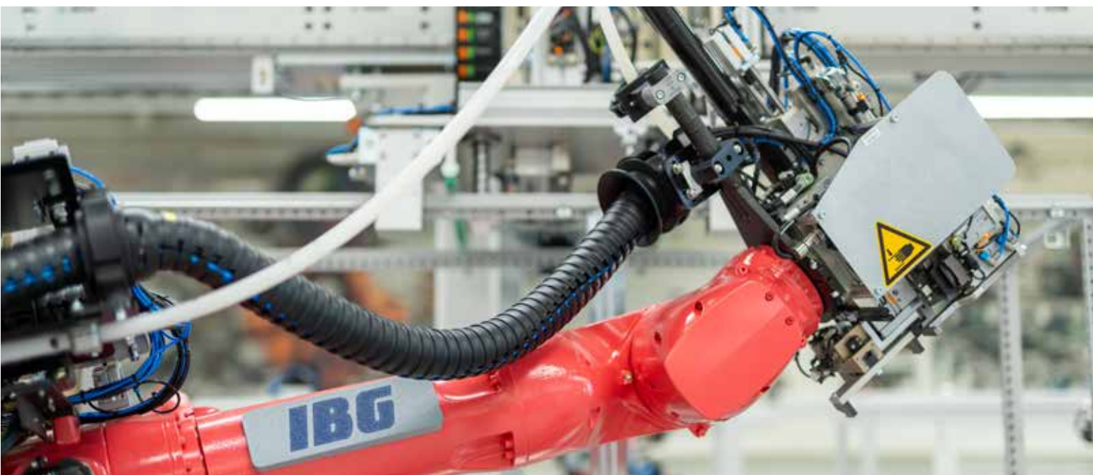
Industrieroboter mit Kombination aus modernster Visionstechnik und komplexer Greiftechnik. Industrial robots with a combination of state-of-the-art vision technology and complex gripper technology.