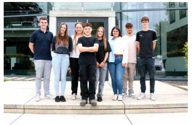
Ausbildungsstart 2024 bei IBG: Willkommen im #TeamIBG! Apprenticeship start 2024 at IBG: Welcome to #TeamIBG!