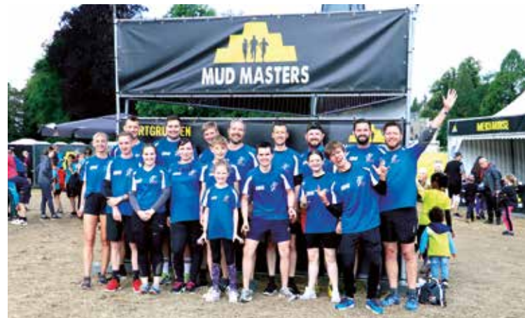
Mud Masters 2024: unser Team vor der unvergesslichen und schlammigen Herausforderung #wirsindibg. Mud Masters 2024: our team before the unforgettable and muddy challenge #weareibg.