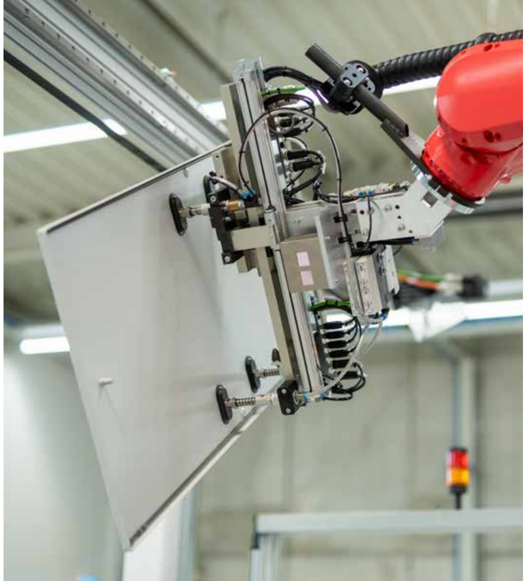
Handling des Deckelblechs zur anschließenden Montage. Handling of the cover plate for subsequent assembly.