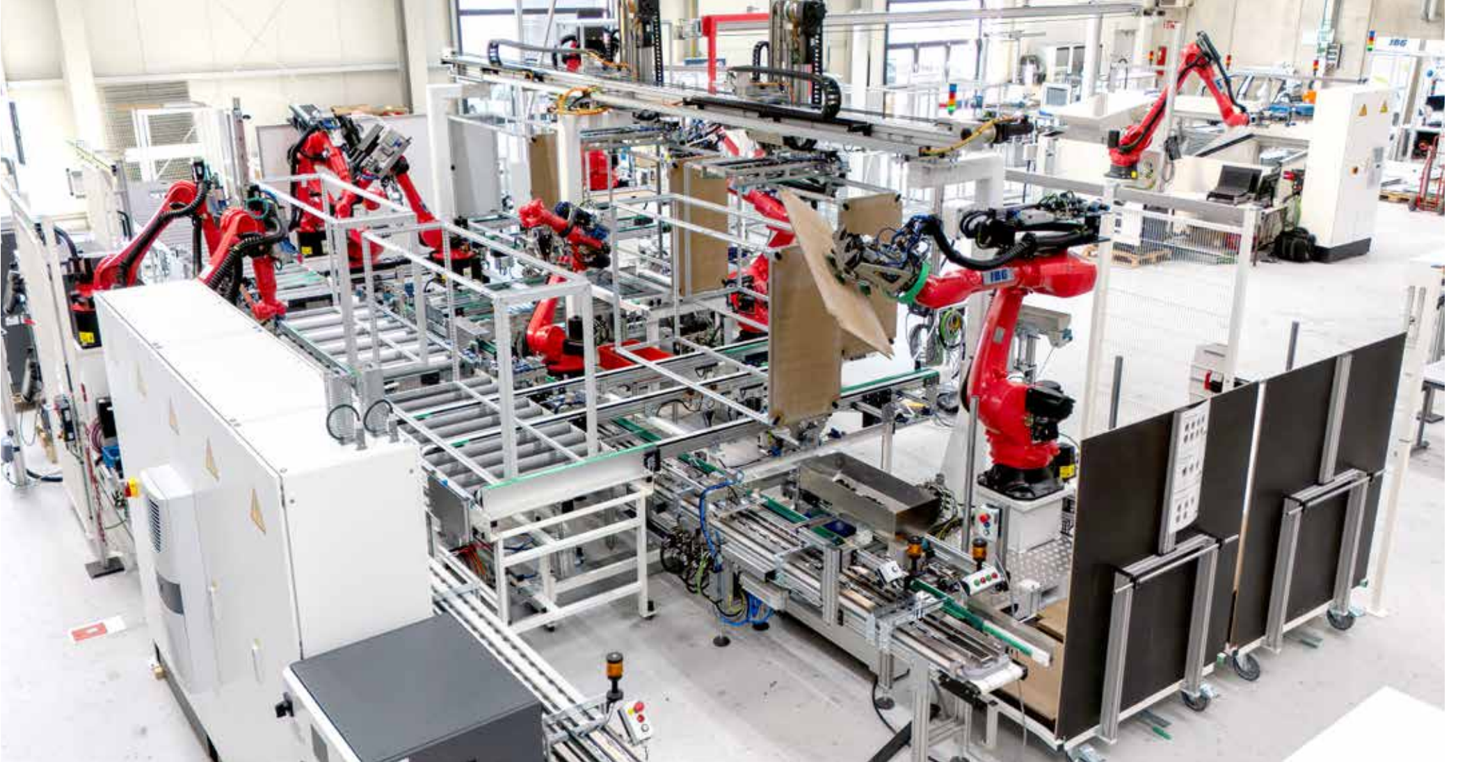
Blick auf die modernste Montagelinie für Schaltschränke mit insgesamt elf Robotern für hochkomplexe Montage- und Schraubvorgänge. View of the state-of-the-art assembly line for control cabinets with a total of eleven robots for highly complex assembly and screwdriving processes.

Ausgabe Frühjahr 2025 | Issue Spring 2025